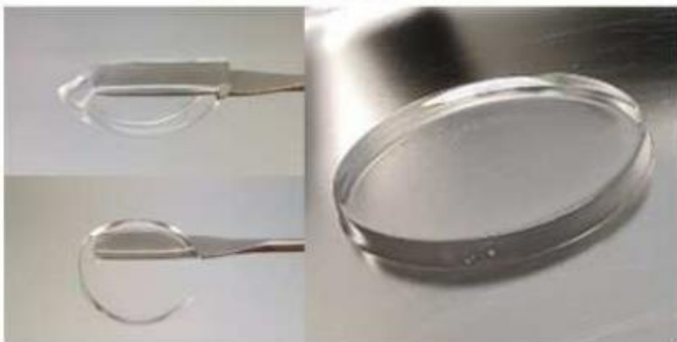
<전자빔 조사후 하이드로겔 생성>

2500 kDa HA 0.5 % + 35 kDa PEG 1 % + 237 Da Silicone 0.5 %