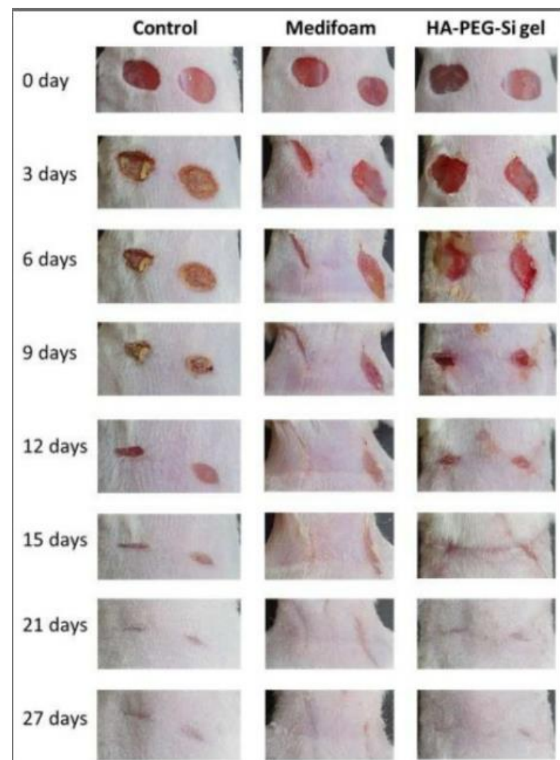
<창상동물모델의 창상부위 처리결과>